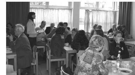
Die Mittagspause gab Gelegenheit zur Stärkung und vielen Gesprächen