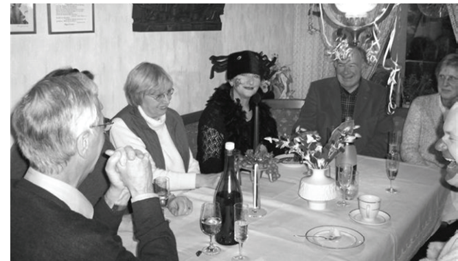
Der „Chor“ und seine Zuhörer bei einer anschließenden kleinen Stärkung