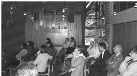
Zuhören in schöner Umgebung